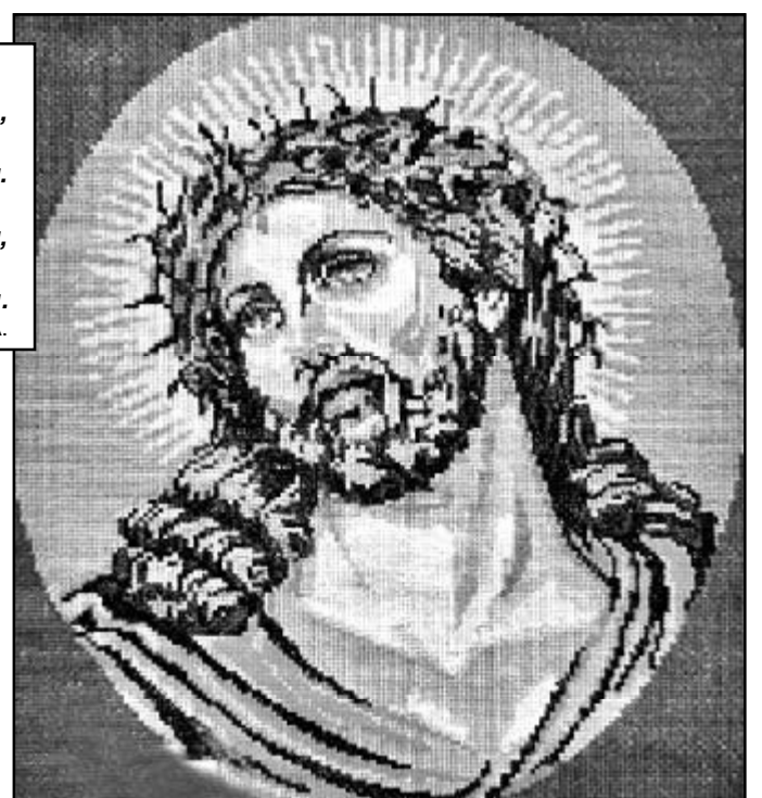
Стану я — мов на чати, Ніби стовп верстовий. Доки буду кричати, Доки буду живий. А. ГУДИМА.