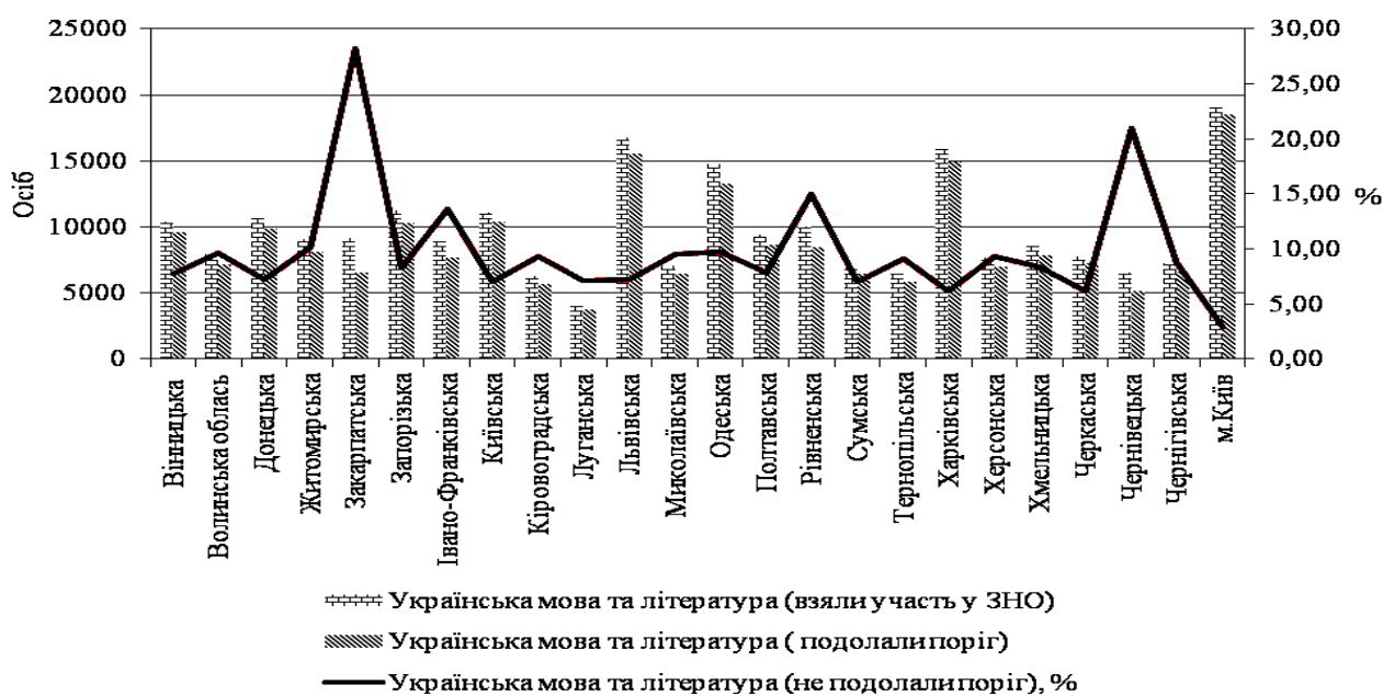
Рис. 1 Кількість учнів, які взяли участь у ЗНО та подолали поріг у 2016 р. за регіонами України [розрахунки автора]

За результати проведеного аналізу (рис.1) можна зробити наступні висновки: 1) у 2016 році за всіма регіонами спостерігається односпрямована тенденція до переважанню кількості учнів, які подали заявки для проходження ЗНО над кількістю тих, що подолали прохідний поріг; 2) найбільша кількість учнів, які взяли участь у ЗНО та подолали прохідний поріг у м. Київ, Львівському, Харківському та Одеському регіонах, найменша їх кількість спостерігається у Ліванському, Чернівецькому, Тернопільському та Миколаївському регіонах; 3) в середньому по Україні не подолали прохідний поріг 9 % учнів. Низький відсоток не проходження порогу спостерігається у м.Київ(3%), Черкаському (6,14%) та Харківському (6,22%) регіонах, найбільш високий відсоток - у Закарпатському (28,19%), Івано-Франківському (13,58%), Рівненському (14,95%) та Чернівецькому(20,95%) регіонах.