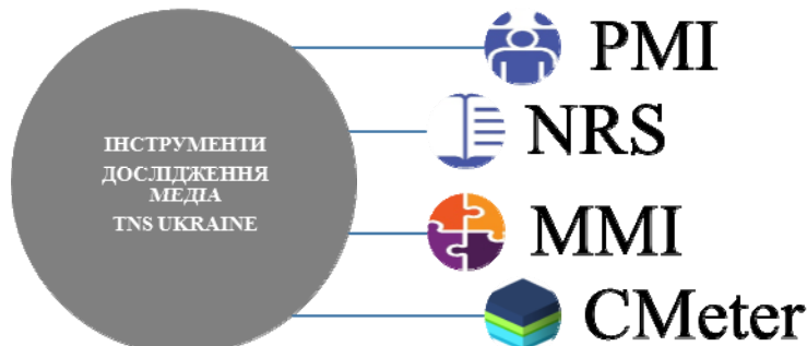
рис. Інструментарій дослідження медіа компанії TNS

Дослідження Print Media Index (PMI) – цей метод вивчає та аналізує соціально-демографічні характеристики та аудиторію немасових видань. Ключовою особливістю проекту є можливість аналізу вузьких та малодоступних цільових груп. В рамках проекту проводиться більше 10 000 інтерв'ю з респондентами у віці 12-65 років у найбільших містах України: Київ, Харків, Дніпропетровськ, Одеса, Львів, Запоріжжя.