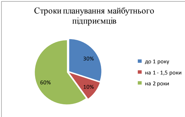
Рис. 1. Строки планування майбутнього у групі підприємців

Строки планування власного майбутнього у групі підприємців розподілилися так (рис. 1).