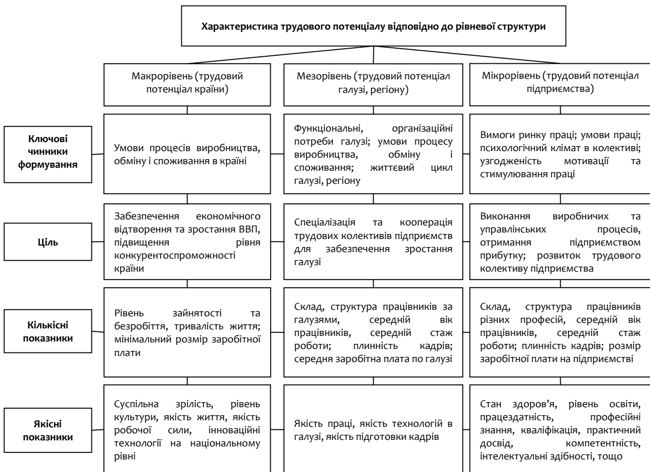
Рис. 1. Характеристика трудового потенціалу відповідно до рівневої структури*

Варто розглянути надані вітчизняним науковцем Лісун Я.В. основні характеристики трудового потенціалу відповідно до рівневої структуризації, а саме на макро-, мезо- та мікрорівнях, оскільки в межах дослідження звертаємось саме до зазначених рівнів (рис. 1) (Lisun, 2014).