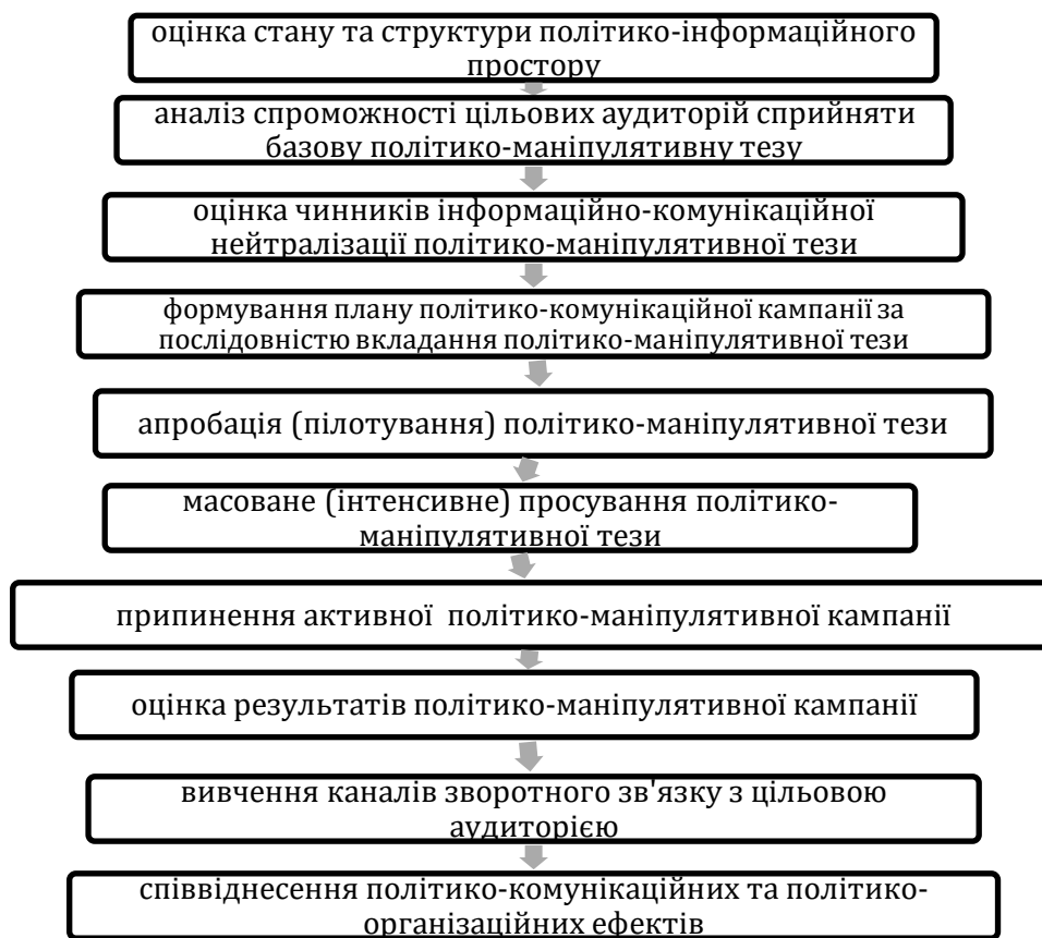
Схема 5. Політико-технологічний алгоритм політико-маніпулятивної кампанії

Крім вузьких завдань політичного маніпулювання, пов'язаних із специфікою політичних цілей кожного політичного актора, на сучасному етапі набувають значення макрополітичні міркування та уявлення, які розкривають можливості наслідків маніпулювання для розвитку всього