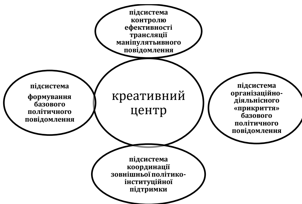
Схема 3. Організаційно-ресурсні вимоги для здійснення політичної маніпуляції

Гіпотези та спростування в рамках дослідження громадської думки стають простором для визначення перспектив конкретних політичних діячів. Оприлюднення результатів досліджень на користь медійних осіб свідчить про прагнення зондування щодо ставлення громадян до новітніх проєктів та політичних сил. Особливо наочно це спостерігається за тривалий період до початку новітньої виборчої кампанії. Прикладом слугує фокусування уваги на особистості Дмитра Гордона станом на грудень 2021 року, виявлене Центром Разумкова. У випадку, якщо лише з таких особистостей складатиметься список кандидатів у виборчому бюлетені президентських виборів, менше