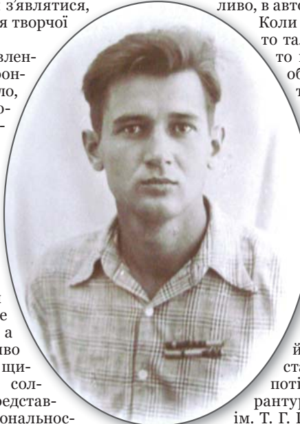
Олесь Гончар – студент ДДУ (1945-1946 рр.).

1946–1947 навчального року ми бачили О. Т. Гончара на засіданнях кафедри. Моя «історична» заслуга полягала в тому, що я просила завідувача кафедри не відривати Олесь від творчої роботи викликами на засідання, де затверджували трафаретні робочі плани. Тоді мені легко було написати не лише свій план, а й для Олесь: там, де в моєму писалось «лекції, практичні заняття», в Олесево-му – «творча робота». Коли ж Олесь за-