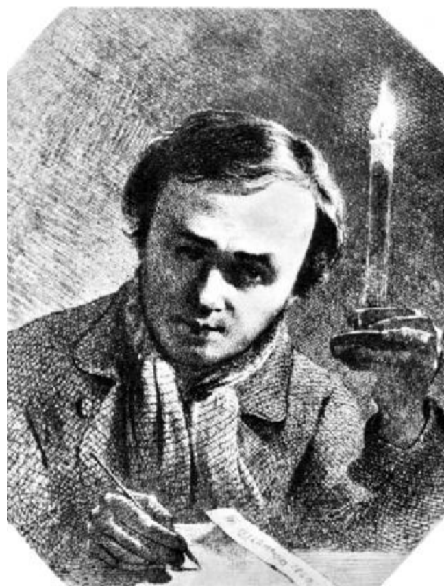
Автопортрет зі свічкою. 1860 р.