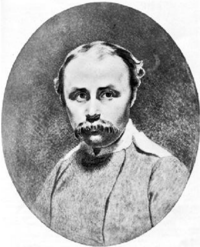
Автопортрет. 1849 р.

РОЗПОВІДАЄМО ПРО ТЕ, ЯК УНІВЕРСИТЕТ ВІДЗНАЧИВ ЮВІЛЕЙ ВІД ДНЯ НАРОДЖЕННЯ ВЕЛИКОГО КОБЗАРЯ