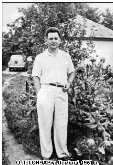
О. Т. ГОНЧАР у Ломівці, 1951 р.