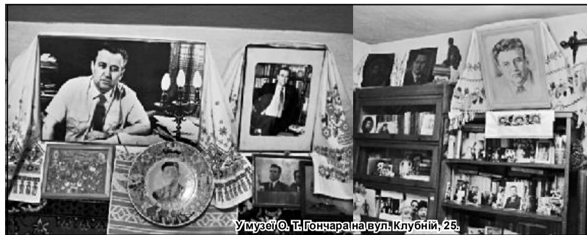
У музеї О. Т. Гончара на вул. Клубній, 25.

камень» та роман «Альпи». Від окопів одігравала не тільки тепла грубка, а й шире родинне тепло. Сестра замінила сім'ю і створила умови для творчості.