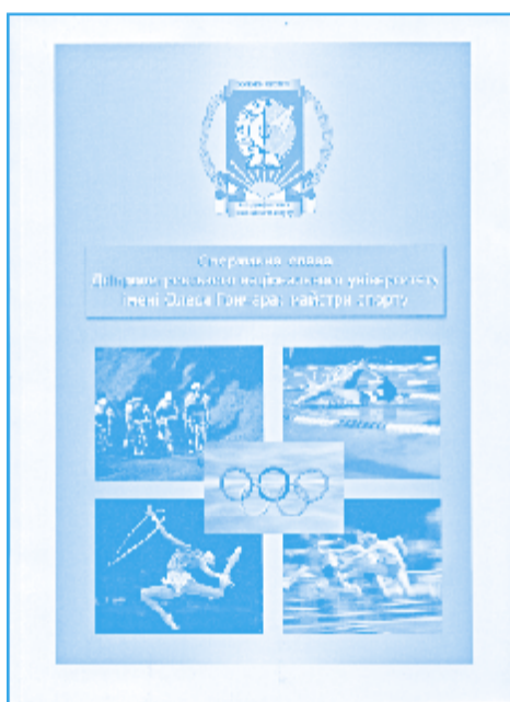
Спортивна слава Дніпропетровського національного університету імені Олесея Гончара: майстри спорту / голова редкол. проф. М. В. Поляков, - Д.: Вид-во ДНУ ім. О. Гончара, 2013.