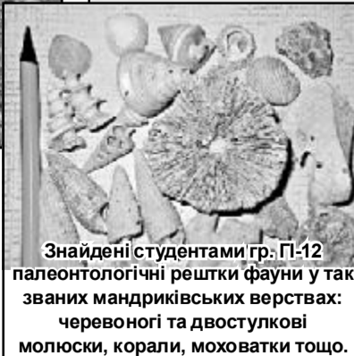
Знайдені студентами гр. ПІ-12 палеонтологічні рештки фауни у так званій мандрівницьких верствах: червононогі та двостулкові моллюски, корали, моховатки тощо.

Відбулися численні лекції, екзамени й заліки, і одним із останніх акордів навчального року була геологічна практика.