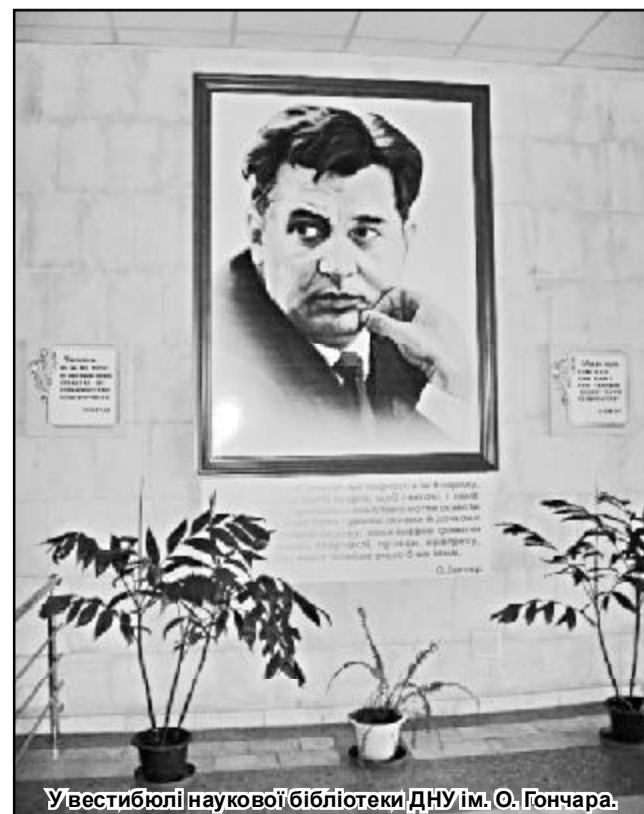
Увєстивіюлі наукової бібліотеки ДНУ ім. О. Гончара.