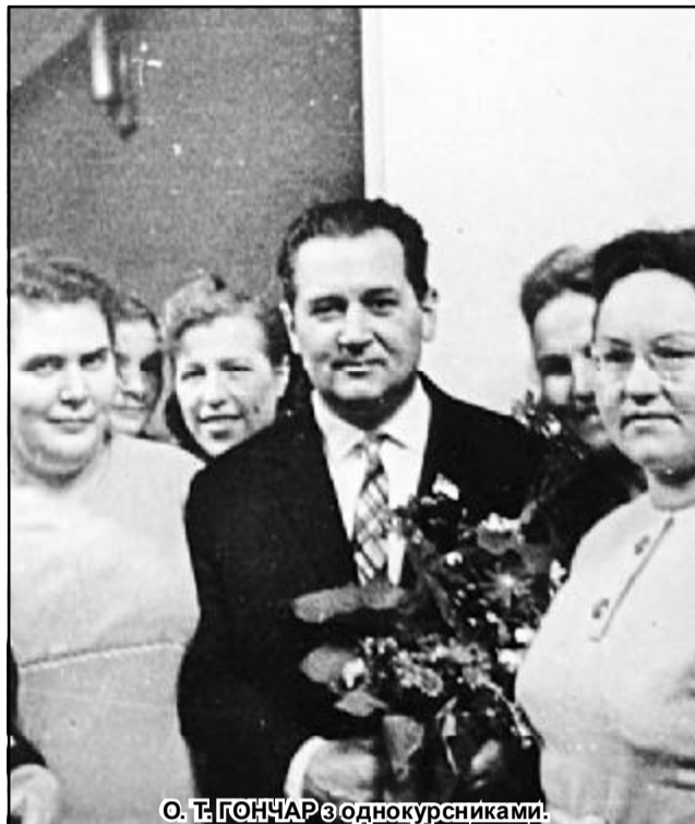
О. Т. ГОНЧАР з однокурсниками.

раний Почесним доктором літератури одного з найпрестижніших у світі Альбертського університету «Канада»; за визначенням Міжнародного біографічного центру у Кембриджі (Англія), «Інтелектуал світу 1993 року».