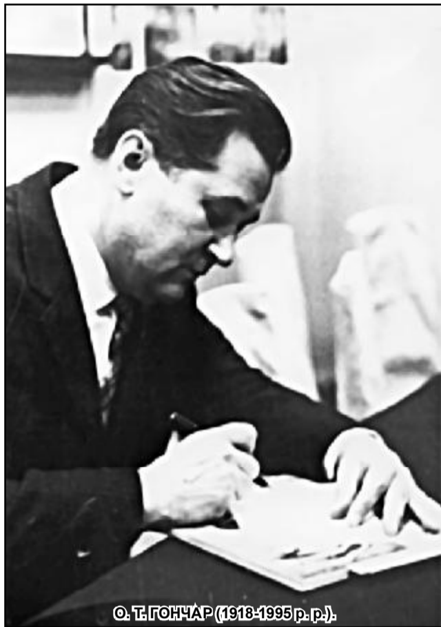
О. Т. ГОНЧАР (1918-1995 р.р.).

О. Т. Гончар – видатний український прозаїк і громадський діяч, академік Академії наук УРСР, Герой Соціалістичної Праці, Герой України.