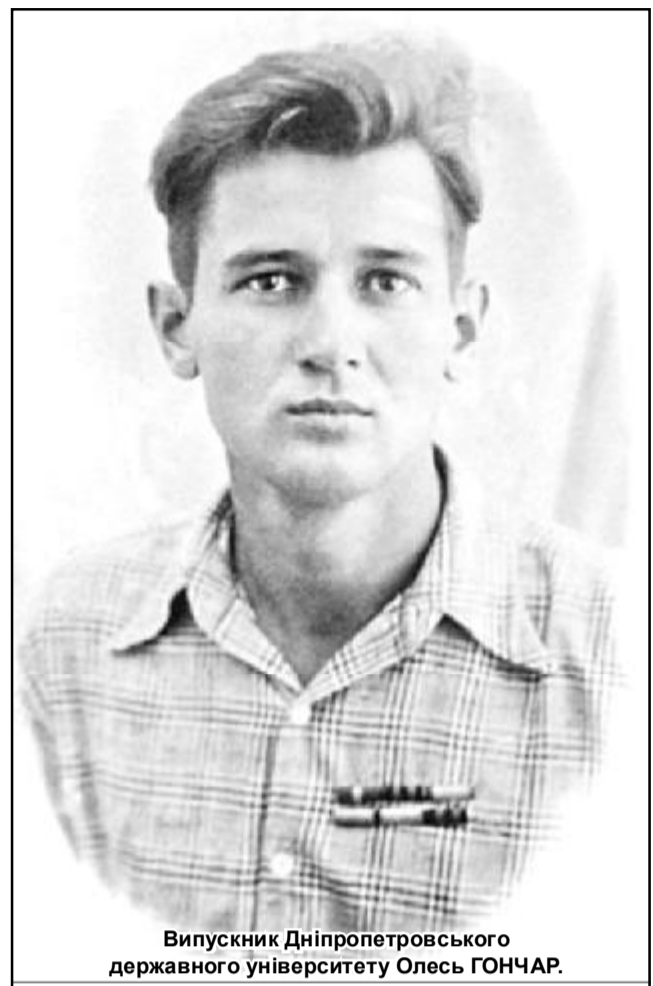
Випускник Дніпропетровського державного університету Олесь ГОНЧАР.

О. Т. Гончар – видатний український прозаїк і громадський діяч, академік Академії наук УРСР, Герой Соціалістичної Праці, Герой України.