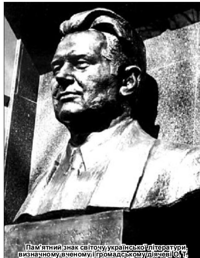
Пам'ятний знак світочужій українській літературі, визначному вченому і громадському діячеві О. Т. Гончару, відкритий 15 квітня 2003 року на фасаді навчального корпусу №2 ДНУ.

Олесь Терентійович Гончар власним прикладом утверджував безсмертя рідного слова, розбудовував храм рідної культури. Мало сказати: Гончар любив Україну. Він жив нею, борючись за неї. «Я й там вас любитиму», – цими щемно-прощальними словами Митець засвідчив сенс свого життя, відданого людям. Він ніколи не відривав творче, громадське від глибоко особистого, найсокровеннішого, інтимного. Він продовжив святу місію письменника як діяча, лицаря, правдборця, не діждався, а вибором омріяну Україну, удостоївшись щастя й честі бути серед обраних на святі її незалежності.