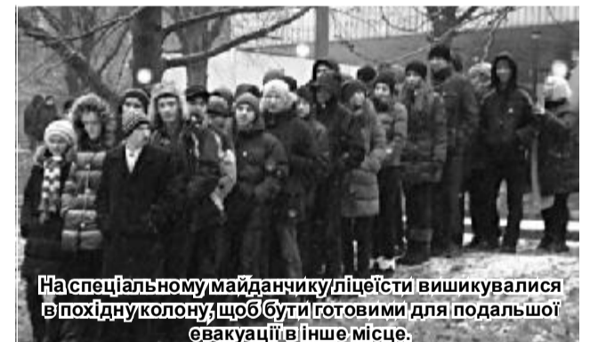
На спеціальному майданчику ліцеїсти вишикувалися в похідну колону, щоб бути готовими для подальшої евакуації в інше місце.