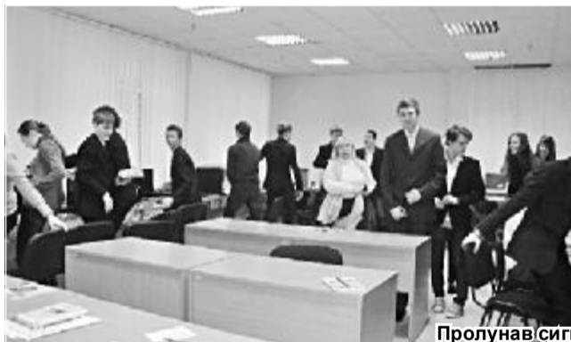
Пролунав сигнал «Увага всім!».