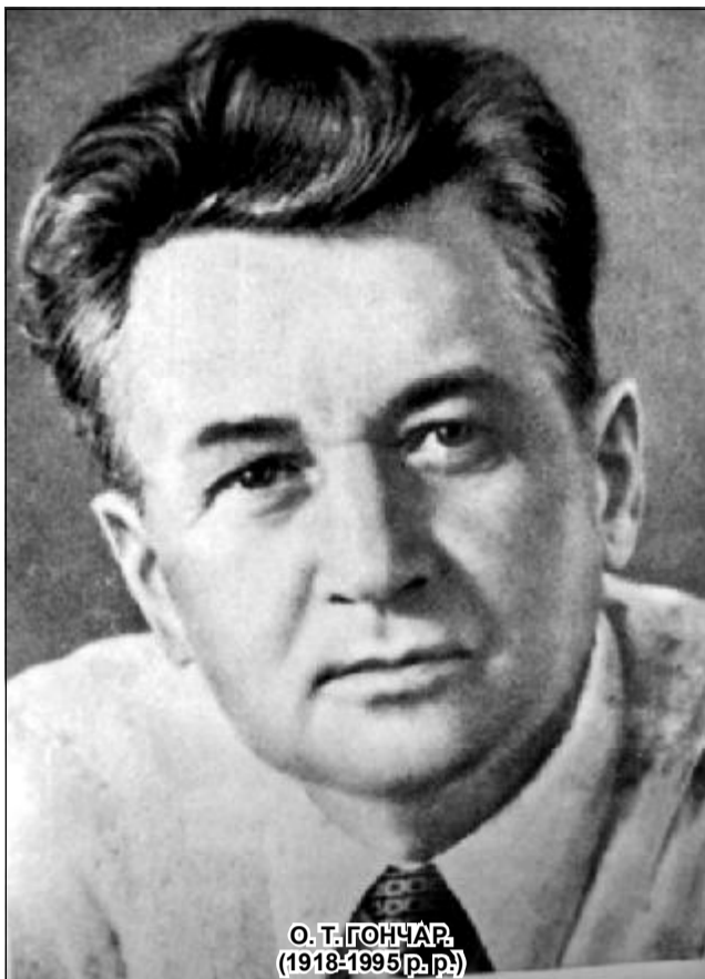
О. Т. ГОНЧАР, (1918-1995 р.р.)

О. Т. Гончар – видатний український прозаїк і громадський діяч, академік Академії наук УРСР, Герой Соціалістичної Праці (1978), Герой України (2005). Відзначений Державними преміями СРСР (1948, 1949, 1982), Державною премією України ім. Т. Г. Шевченка (1962), Ленінською премією (1964), Золотою медаллю ім. О. О. Фадєєва, премією ім. С. К. Неймана (Чехія), 1992 року обраний Почесним доктором літератури одного з найпрестижніших у світі Альбертського університету (Канада); за визначенням Міжнародного біографічного центру у Кембриджі (Англія), «Інтелектуал світу 1993 року».