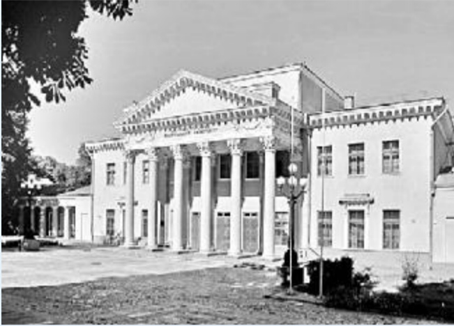
Палац культури студентів імені Юрія Гагаріна.