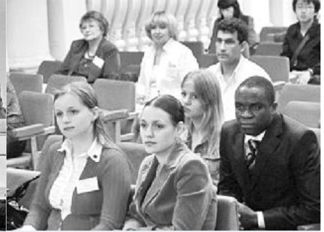
XIV Міжвузівська науково-практична конференція іноземних студентів «Бережи цей світ, Людино!»