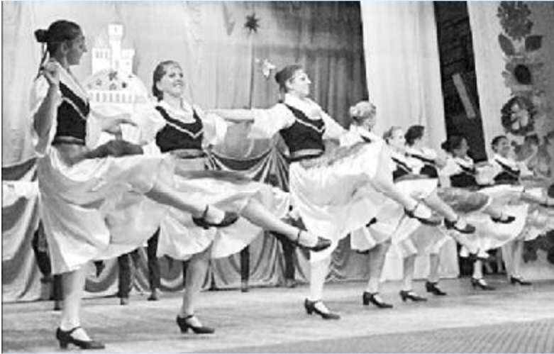
Танцює народний ансамбль фольклорного танцю «Веселка».