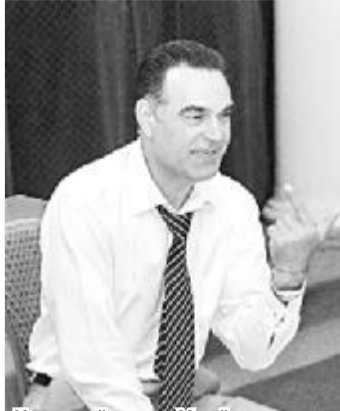
Народний артист України, директор театру одного актора «Крик» Михайло Мельник у культурологічному клубі «В гостях у ректора ДНУ імені Олеса Гончара».