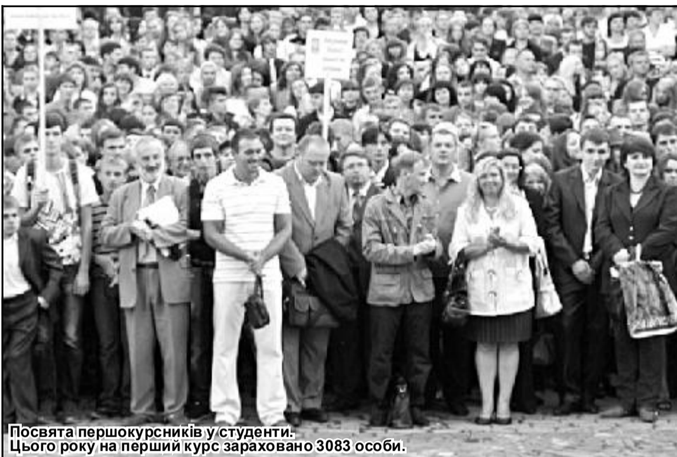
Посвята першокурсників у студенти. Цього року на перший курс зараховано 3083 особи.