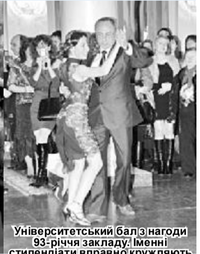
Університетський бал з нагоди 93-річчя закладу. Іменні стипендіати вправно кружляють у вальсі зі своїми деканами і проректорами.