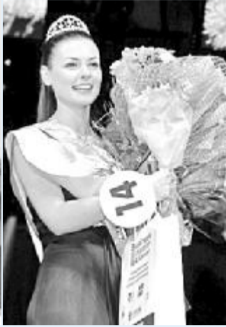
На ІХ міжфакультетському конкурсі «Міс Університет-2012».