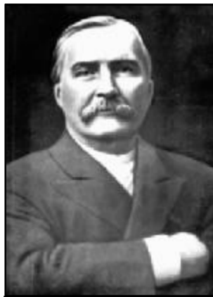
ЛИСЕНКО Микола Віталійович, композитор, піаніст, педагог, культурно-громадський діяч, один із основоположників української класичної музики (1842-1912).

Знімки з книжок, що вийшли у світ до 90-річчя ДНУ ім. О. Гончара, та власних фотоальбомів співробітників.