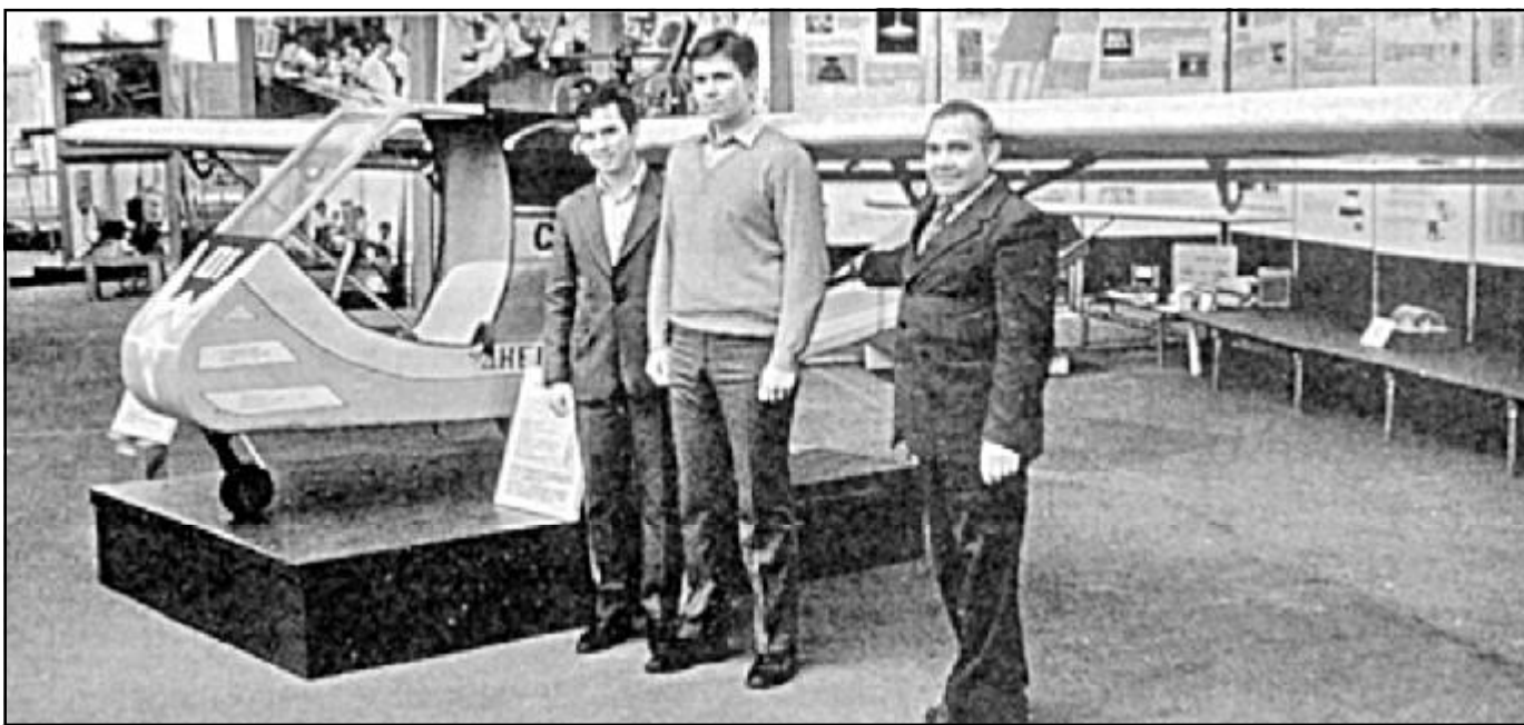
1970-і роки. Одномісний тренувальний планер, спроектований і виготовлений у СКБ малогабаритних літальних апаратів при кафедрі проектування і конструкцій фізико-технічного факультету під керівництвом доцента В. Ф. Натушкіна.