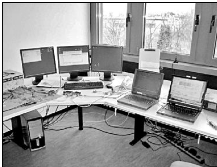
Лабораторія космічного зв'язку. Антени встановлені на 10-ому корпусі. Комп'ютери невдовзі надійдуть від партнера по «ТЕМПУСУ» Берлінського технічного університету.

У лабораторії студентів чекає цікава робота. Уже в цьому навчальному році вони встановлять зв'язок із німецьким студентським мінісупутником, запущеним на орбіту у 2008 році, і прийматимуть інформацію про стан бортової апаратури. Як тільки полетить наш наносупутник, фізтехівці керуватимуть ним і прийматимуть знімки поверхні Землі.