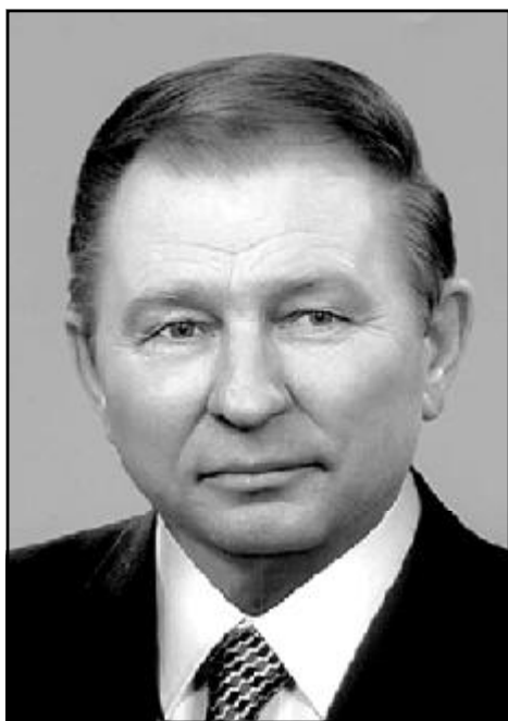
КУЧМА Леонід Данилович

ВИПУСКНИКИ – ГОРДІСТЬ НАЦІОНАЛЬНОГО УНІВЕРСИТЕТУ