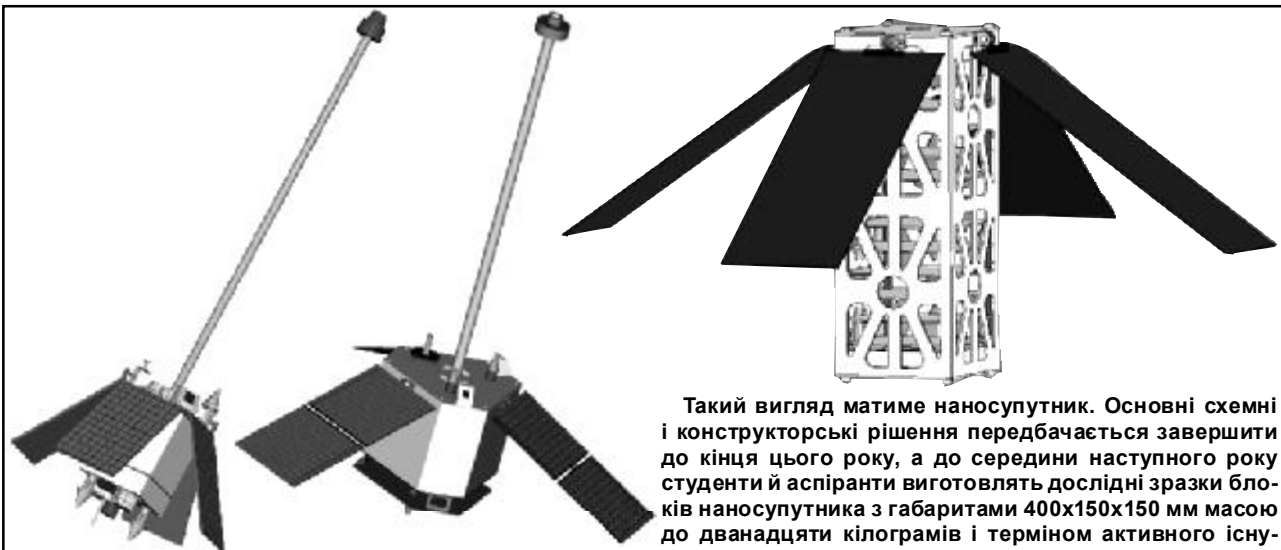
Українські молодіжні супутники УМС-1 і УМС-2. За їх проектами в рамках Національної космічної програми України фізико-технічний факультет ДНУ розробив технічні завдання, а на УМС-1 виконав ескізний проект.

О. М. ПЕТРЕНКО: – Наносупутник – це спеціалізований прилад, який фотографуватиме земну поверхню цифрою фотокамерою з керованою фо-