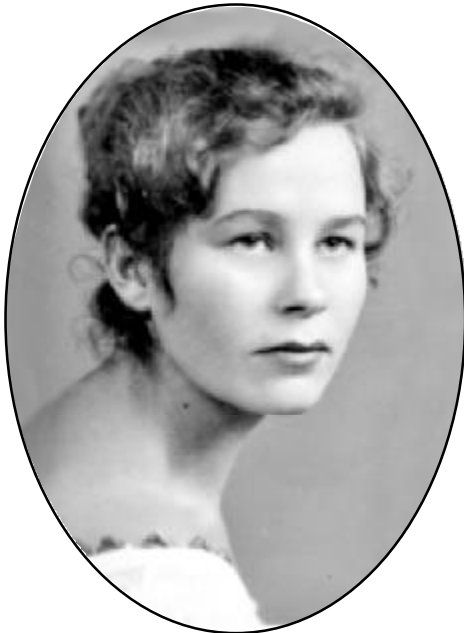
нів з молоком. Те молоко привозили просто з ферми, і його дозволялося пити без обмежень, як воду.

Через роботу в різні зміни я з нею майже не зустрічалася. Хіба що привітаємося на кухні, за нашим довгим столом. Чи біля бідо-