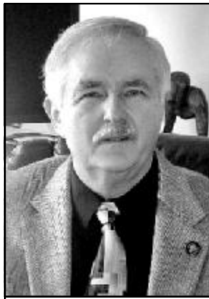
ЛЕЩИНСЬКИЙ Ежи Професор Джексонського державного університету (США)