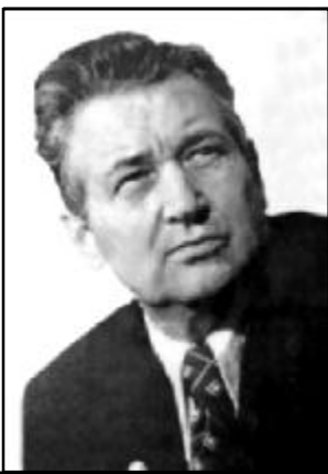
ГОНЧАР Олесь Терентійович Випускник університету 1946 р., видатний український письменник, академік НАН України, Герой Соціалістичної Праці, Герой України