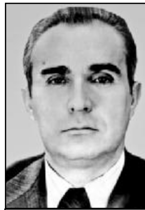
СЕМЕНОВ Юрій Павлович Випускник університету 1958 р., генеральний конструктор НПО «Енергія» (м. Москва), академік РАН, доктор технічних наук, професор, Герой Соціалістичної Праці