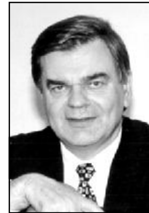
КРЕМЕНЬ Василь Григорович Президент Академії педагогічних наук України, академік НАН і АПН України, доктор філософських наук, професор