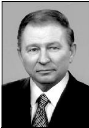
КУЧМА Леонід Данилович Випускник університету 1960 р., Президент України у 1994 – 2004 рр., професор