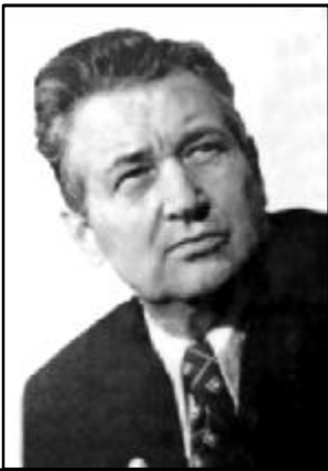
ГОНЧАР Олесь Терентійович Випускник університету 1946 р., видатний український письменник, академік НАН України, Герой Соціалістичної Праці, Герой України