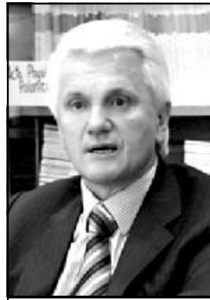
ЛИТВИН Володимир Михайлович Голова Верховної Ради України, віце- президент НАН України, академік, доктор історичних наук, професор, Герой України