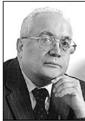
САДОВНИЧИЙ Віктор Антонович Ректор Московського державного університету ім. М. В. Ломоносова, віце-президент РАН, академік, доктор фізико- математичних наук, професор