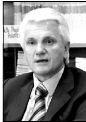
ЛИТВИН Володимир Михайлович Голова Верховної Ради України, віце- президент НАН України, академік, доктор історичних наук, професор, Герой України