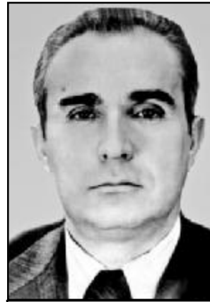
СЕМЕНОВ Юрій Павлович Випускник університету 1958 р., генеральний конструктор НПО «Енергія» (м. Москва), академік РАН, доктор технічних наук, професор, Герой Соціалістичної Праці