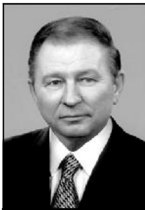
КУЧМА Леонід Данилович Випускник університету 1960 р., Президент України у 1994 – 2004 рр., професор