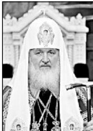
Святіший КИРИЛО Патріарх Московський і всієї Русі