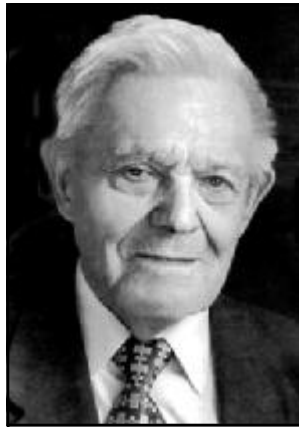
НИКОЛЬСЬКИЙ Сергій Михайлович Випускник університету 1939 р., академік РАН, доктор фізико- математичних наук, професор