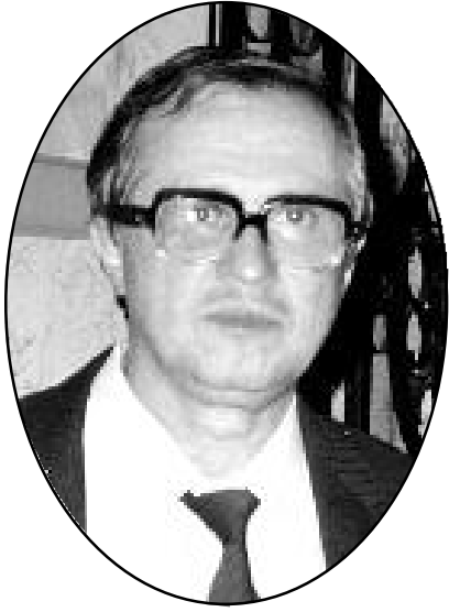
В. В. РОССІХІН , доктор фізико-математичних наук, професор, академік Української технологічної академії та Нью-Йоркської академії наук.