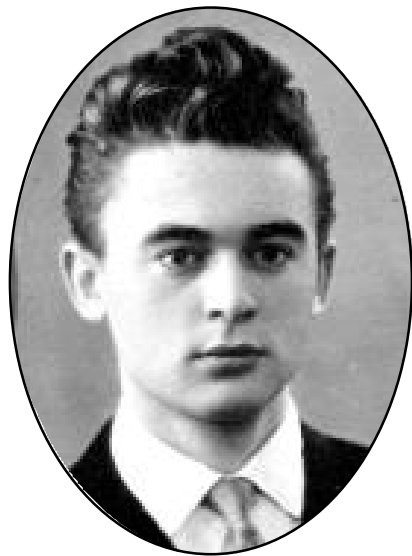
В. Г. КОМАНОВ , к. т. н., заступник Генерального конструктора КБ «Південне», директор програми «Морський старт», лауреат Ленінської премії, Державної премії України, Герой України.