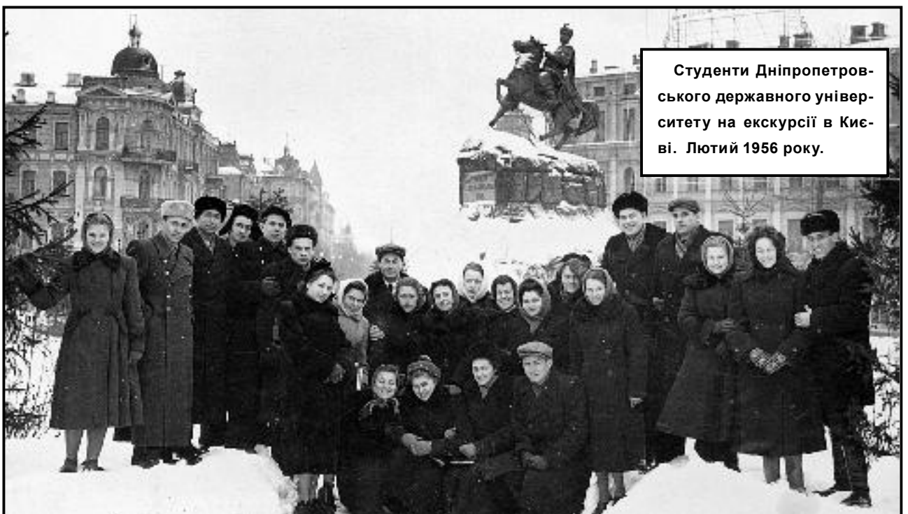
Студенти Дніпропетровського державного університету на екскурсії в Києві. Лютий 1956 року.