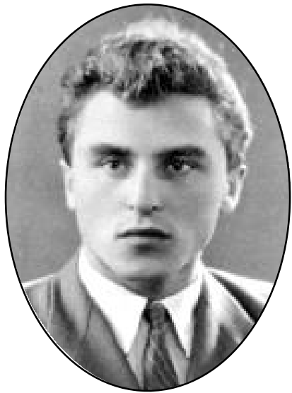
В. М. САЙГАК , провідний конструктор, Герой Соціалістичної Праці, лауреат Державної премії (1971 р.), Державної премії Російської Федерації в галузі науки і техніки (1993 р.).