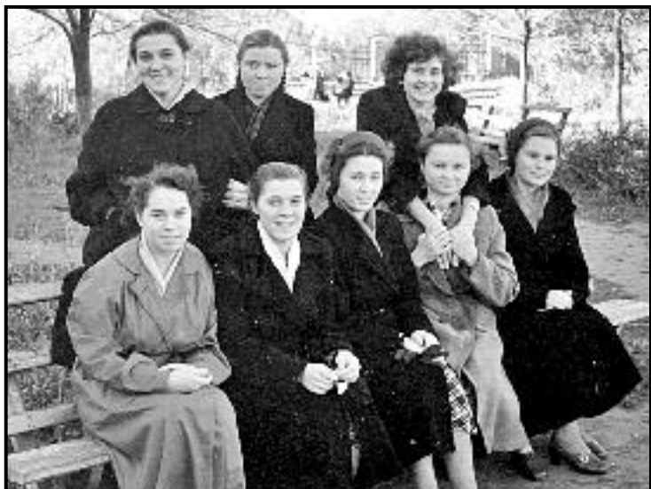
Улюблене місце для фотографування перед гуртожитком.

Наказом ректора університету від 31 грудня 1958 року за подання значної допомоги студентам-заочникам фізико-математичного факультету