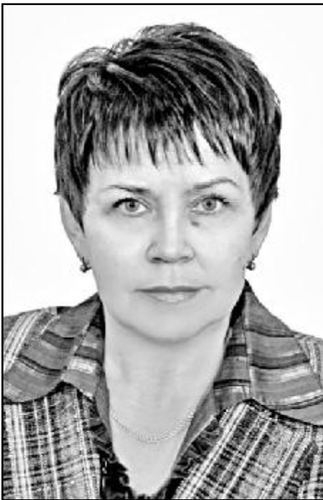
Мені здається, що поет повинен бачити те, що не бачать інші, бачити глибше за інших. І те саме повинен і математик. С. В. Ковалевська.