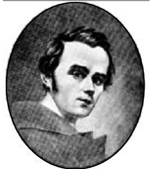
Автопортрет Шевченка Т.Г. 1840-1841 р. р.

Теори Шевченка переживуть віки і вічно будитимуть у серцях людей благородні великі почуття.