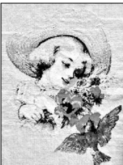
А мале хлоп'я давно вже Степом котиться — летить... Сяють вогниками очі, Серце пташкою тремтить... О. ОЛЕСЬ.