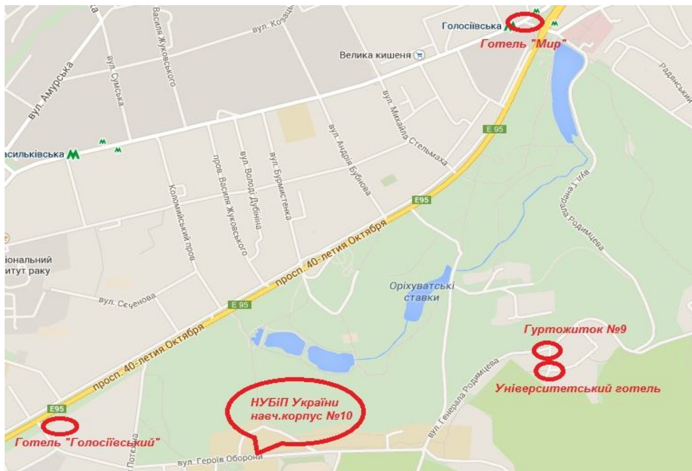
Схема розташування найближчих готелів та гуртожитків

За додаткову оплату можливо замовлення сніданку