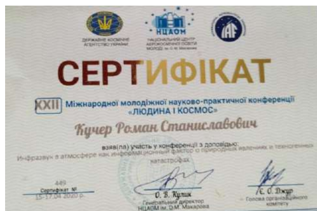
Рис. 3. Сертифікат учасника конференції «Людина і космос».

В останні роки доповідачам-студентам та молодим вченим видаються сертифікати учасника конференції. На рисунку 3 наведений сертифікат учасника конференції «Людина і космос».